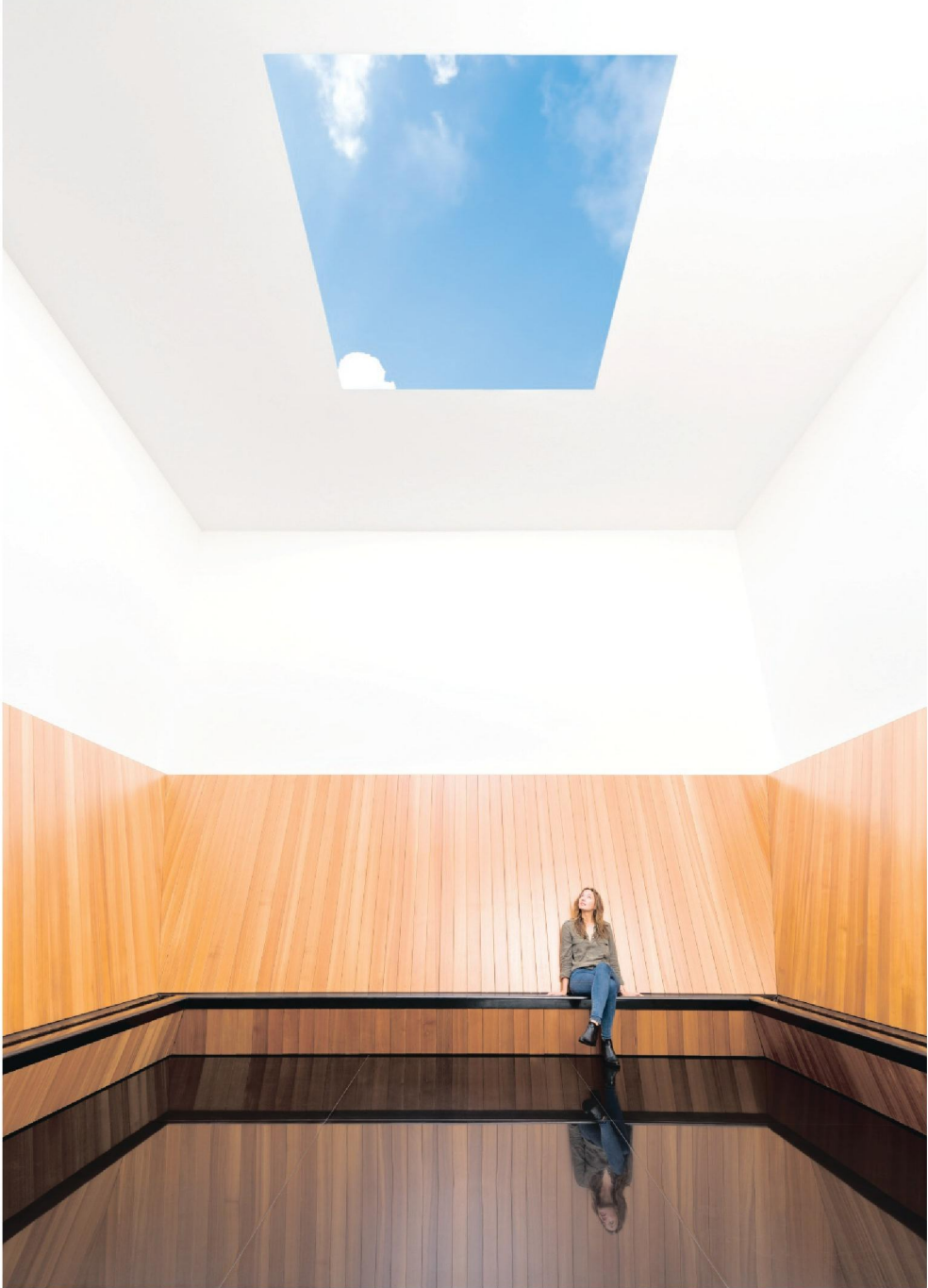
'Sky Space' van James Turrell in Museum Voorlinden.