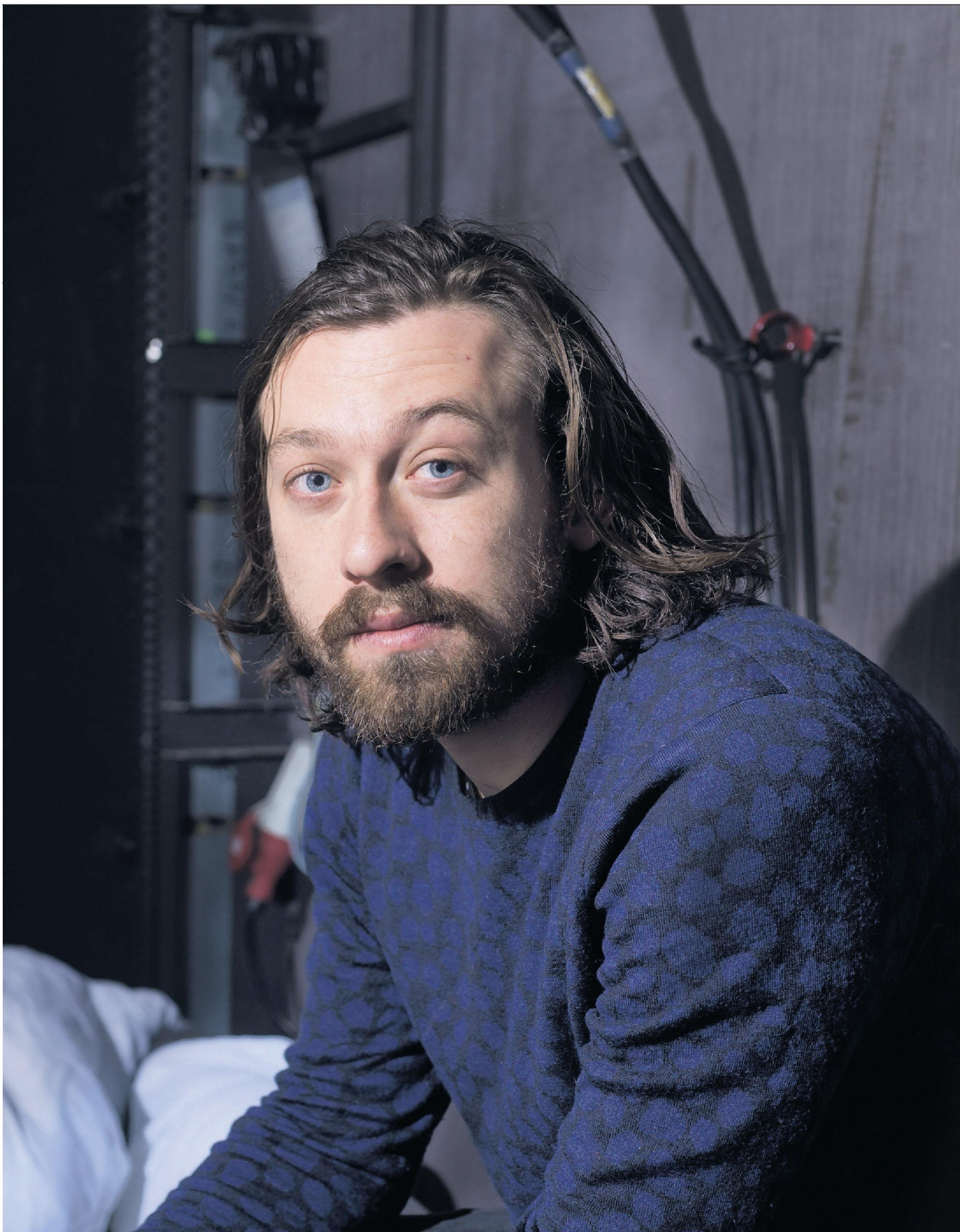
Voordat Simon Stone gaat schrijven, luistert hij aandachtig naar de acteurs.