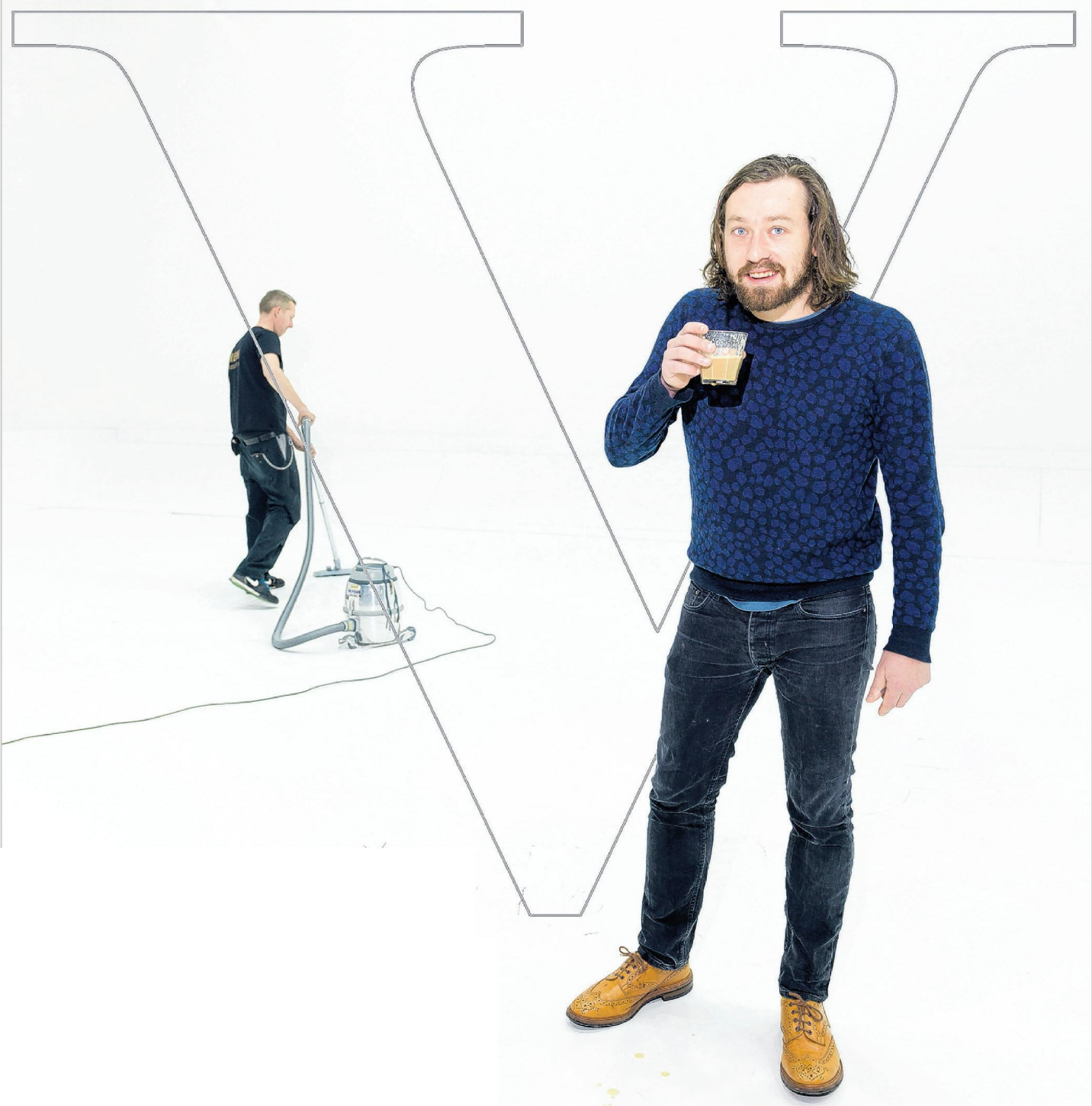
De 30-jarige regisseur Simon Stone herschreef Medea voor Toneelgroep Amsterdam.